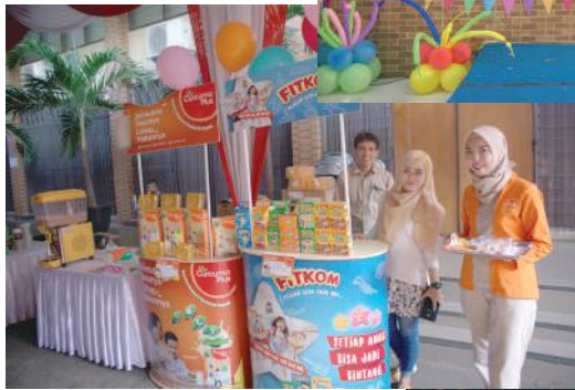
SD Budi Mulia